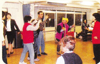
手話サークル「つたの会」 手話劇の練習風景