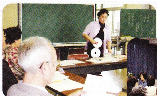
オストメイト講座

料理講座(季節の料理、透析食等)や健康講座(オストメイト講座等)、余暇講座など、在宅生活に必要な講座を行っています。