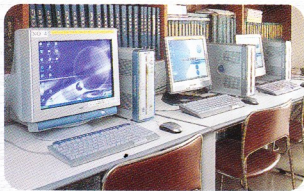
図書室のパソコンコーナー

障害者文化作品展や、囲碁・将棋大会などの開催、スポーツへの取り組みも行っています。 また、センター内にはパソコン・点字プリンターを配備していますので、いつでもご自由にご利用いただけます。