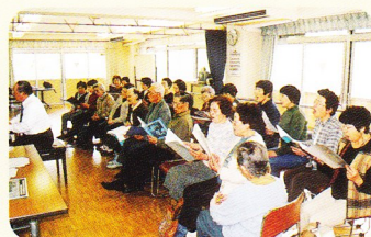
視覚障害者コーラスグループ 「ひびき」