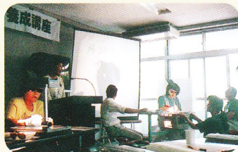
要約筆記サークル 「みみかき」