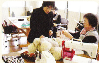
服のリフォームボランティア 「ピンクッション」