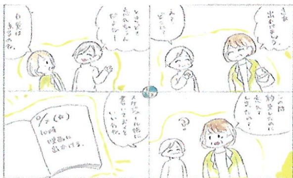
記憶障害とその工夫

うらめんちえっくしーとをごきりょう うえ * 裏面チェックシートをご記入の上 ご持参ください