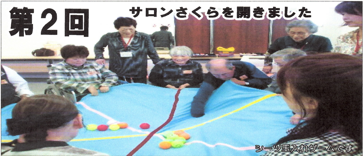
シーツ玉入れゲームです

10月17日(土)12時から「ハピネスふくちやま」において「第2回サロンさくら」を11名の参加で開きました。